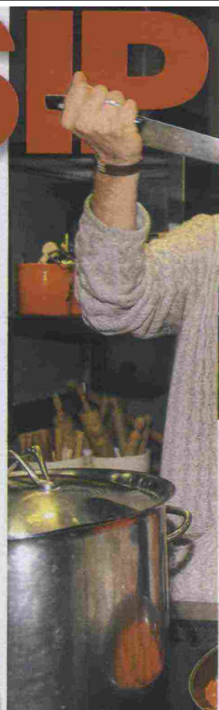
Milano. Il direttore di "Chi" Alfonso Signorini con Valeria Marini e Bruno Barbieri al Teatro 7 per il secondo "Chiacchieriamo", la serie di incontri fra Signorini e (gli appassionati) lettori del settimanale. Per l'occasione Valeria ha preparato cotolette (a forma di cuore) con la supervisione del superchef (7 stelle Michelin) Bruno Barbieri. Intanto si è parlato (non solo) di cucina e di gossip. E di amori, vita e passioni. A partire dalla Marini per toccare le storie di tanti vip che animano il giornale.